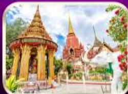
หอพระหลวงปู่ทวด วัดช้างให้