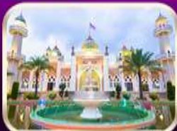
ชมมัสยิดกลางปัตตานี