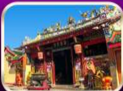
ศาลเจ้าแม่ลิ้มกอเหนี่ยว

ที่เที่ยวเพิ่มขึ้น และ ช่วยฟื้นฟูเศรษฐกิจภาคใหญ่