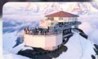
ทานอาหารที่ Piz Gloria ภัตตาคารที่หมุนได้ 360 องศา