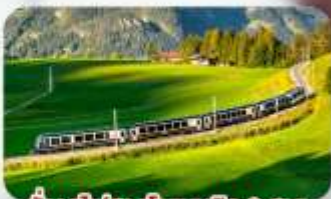
นั้งรถไฟสายโรเมนติก 2 สาย Golden Pass / Luzern Interlaken Express