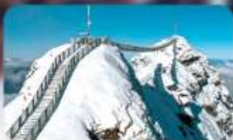
พิชิต 3 ยอดเขาดัง Rigi / Schilthorn / Glacier 3000