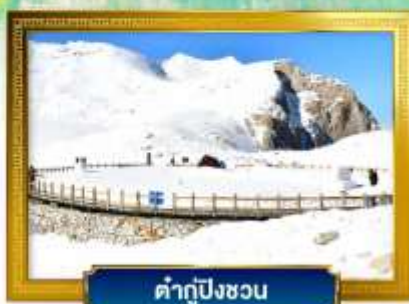
คำกู่ปิงชวง

ช้อปปิ้งจุดถนนคนเดินชุนซีลุ่ ถนนไทกู่หลี่