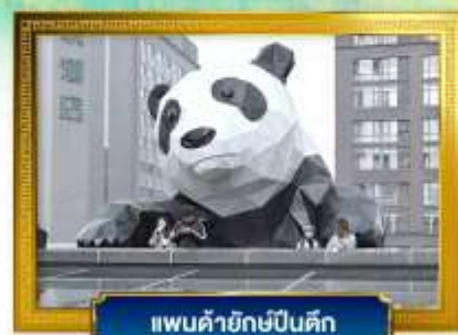
แพนด้ายักษ์ปิ่นตึก