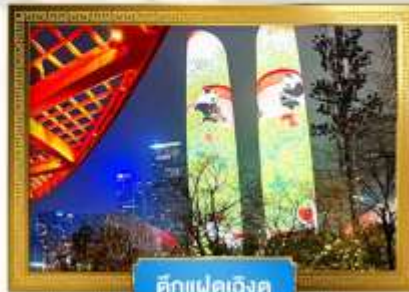
ตึกแฝดเจินตู