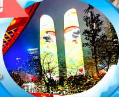
ตึกแฝดเฉิงตู

มรดกโลกพาคินแกะสลักเขาเป่าตั้งซั้บ มรดกโลกอุทยานหลุมฟ้า นั้งรถรางชมมรดกโลกเขานางฟ้า ชมรถไฟฟ้าลู่ศตึก ซ้อปั้งหงหยาดัง, เจี้ยฟางเปี้ย