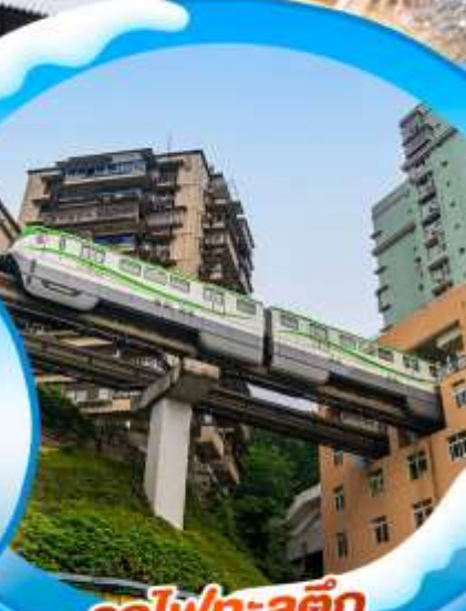
รถไฟฟ้าลู่ศตึก