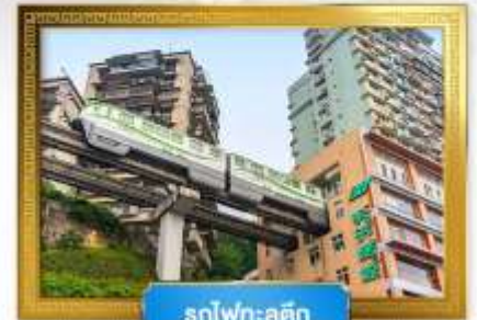
รถไฟฟ้าลูตึก