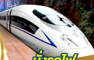
นั่งรถไฟ ความเร็วสูง