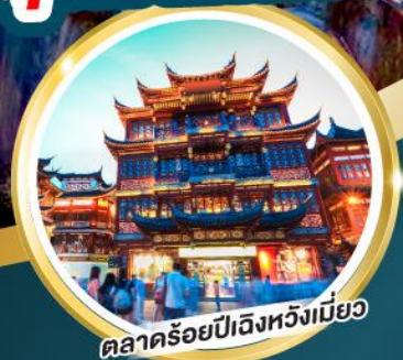
ตลาดร้อยปีฉงชียนกู่