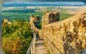
กำแพงเมืองโบราณซิกนากี