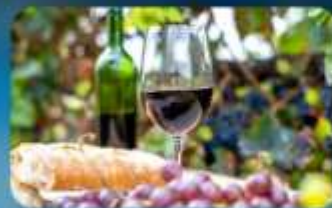
พิเศษ!! ซิมไวน์ท้องถิ่น