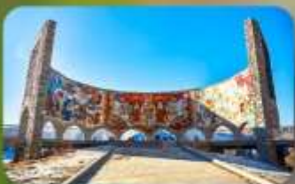
อนุสรณ์สถานรัสเซีย-จอร์เจีย