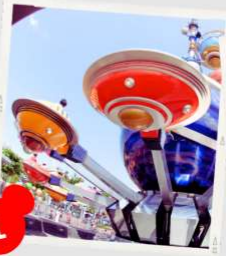
MAIN STREET USA