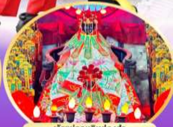
เจ้าแม่กวนอิมฮ่องกง นมัสการองค์เจ้าแม่กวนอิมที่มีอายุกว่า 600 ปี