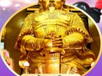
วัดชยกงหนิว พระโศภนาก ภาวนาถ้ำ และจุดชมวิว