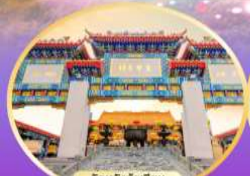
วัดหวังคำเซียน พุทธอุทยาน ภาวนาถ้ำ