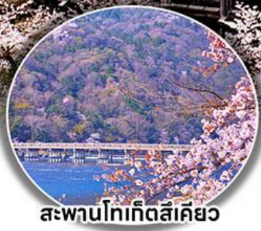
สะพานโทเก็ตสึเคียว