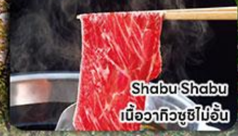
Shabu Shabu เนื้อวากิวซูชิพรีเมียม