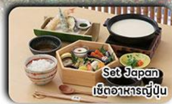
Set Japan เซตอาหารญี่ปุ่น