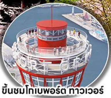
ขึ้นชมโทเบพอร์ต ทาวเวอร์