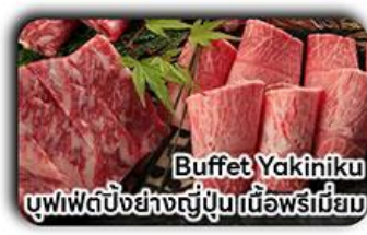
Buffet Yakiniku บุฟเฟต์บิงย่างญี่ปุ่นเนื้อพรีเมียม