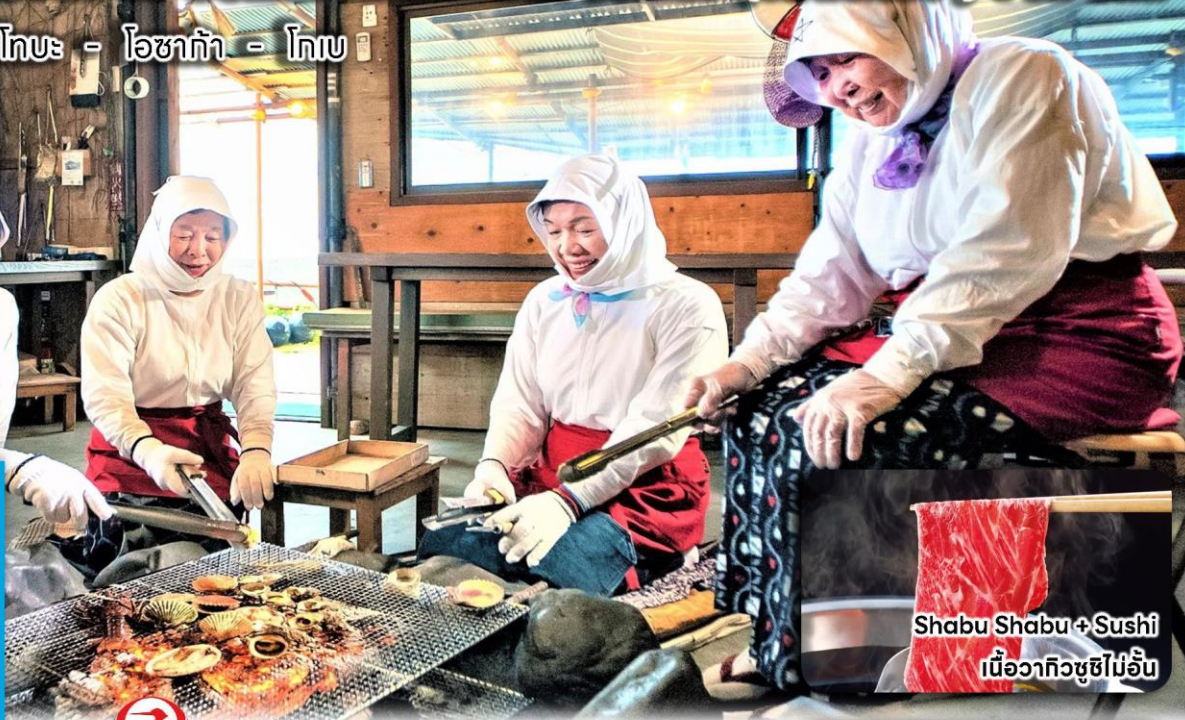
Shabu Shabu + Sushi เนื้อวากิวซูชิไม่อื่น