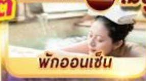
พักผ่อนเซ็น