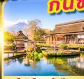
โอชิโนะ อักโท