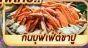
กินบุฟเฟ่ต์ชาบู