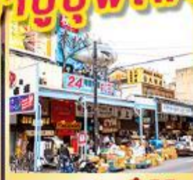
ตลาดปลาชิทิจิ