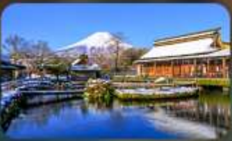
โอชิโนะฮัคโค