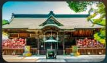
วัดโซรินซัง คารุมะจิ