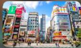
ซัปโปะริงชินจูกุ