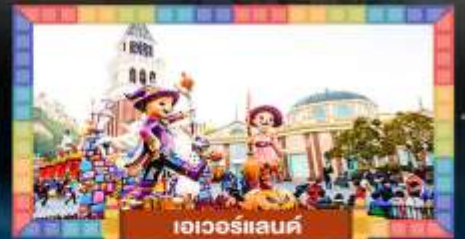
เอวอร์แลนด์