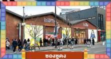
ช้อปปิ้ง

เล่นสกีท่ามกลางหิมะแดนกิมจิ ตะลุยสวนสนุกกาเอวอร์แลนด์