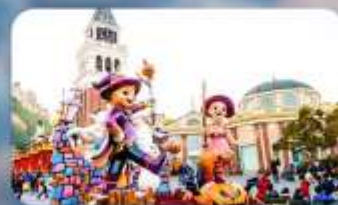
เอเวอร์แลนด์