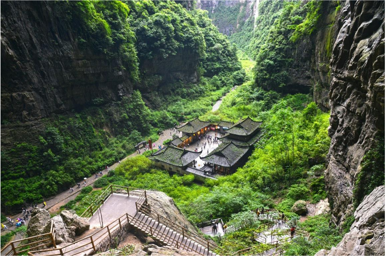
กลางวัน รับประทานอาหารกลางวัน ณ ภัตตาคาร (มือที่ 5)