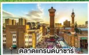
ตลาดแกรนด์บาซาร์