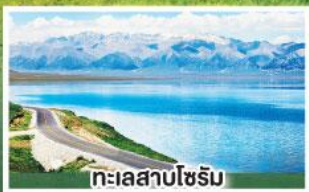
ทะเลสาบไซรัม