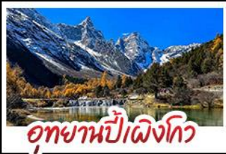
อุทยานป่าเผิงโกว

อุทยานสี่ดรุณี - อุทยานป่าเผิงโกว - อุทยานจิวจ้ายโกว รถไฟความเร็วสูง - EASTERN SUBURB MEMORY ถนนโบราณความจำย - วัดต้าฉือ ช้อปปิ้งย่านคัง ถนนไท่กู่หลี่ + ถนนซุนซีลู่