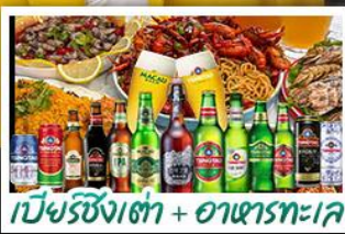
เบียร์ชิงเต่า + อาหารทะเล