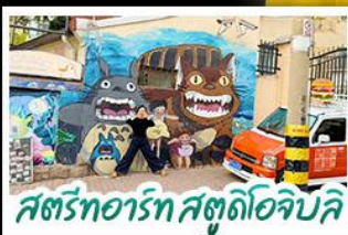
สตรีทอาร์ต สตูดิโอจิบลิ