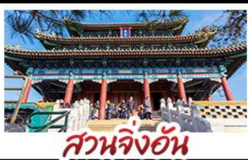
สวนจิ้งอัน