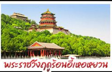
พระราชวังฤดูร้อนอี้ทงหยวน

10 - 14 มิ.ย. 69 28,888 17 - 21 มิ.ย. 69 29,888 24 - 28 มิ.ย. 69 29,888