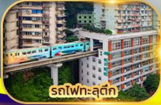
รถไฟทะลุตึก