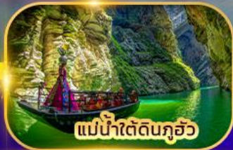
แม่น้ำใต้ดินกุ้ยโจว