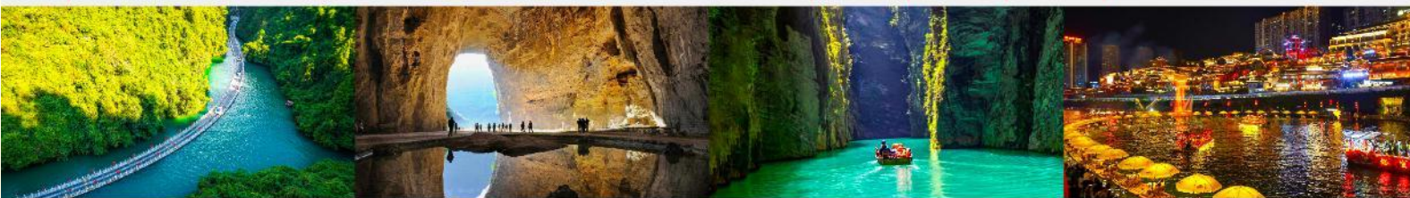
หุบเขาสิงโต