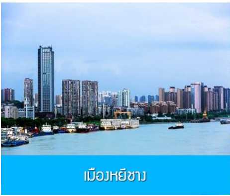
เมืองหยีซาง