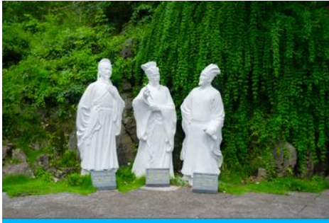
สวนเก้าสามสาย