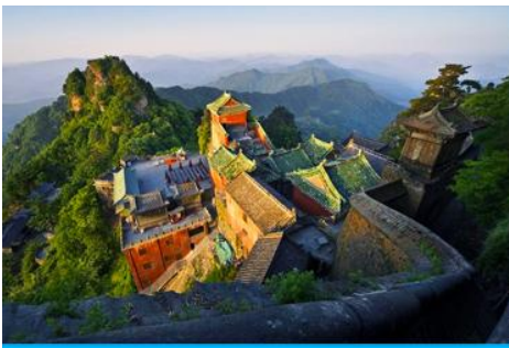
กระเช้าขึ้นเขาบู๊ตึง