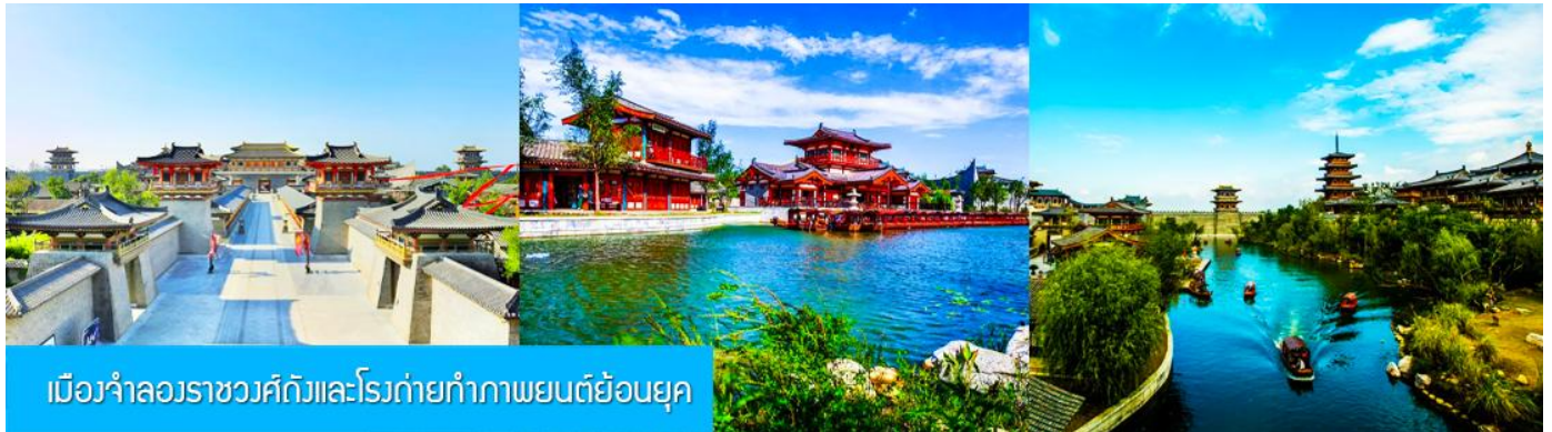
เมืองจำลองราชวงศ์ถังและโรงถ่ายทำภาพยนตร์ย้อนยุค