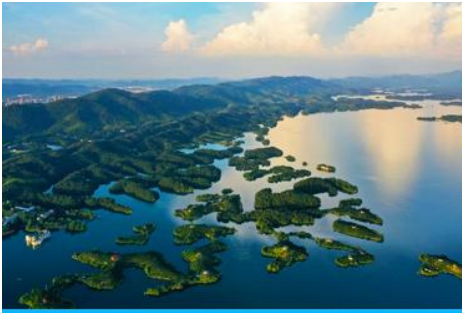
เมิวชือปี้