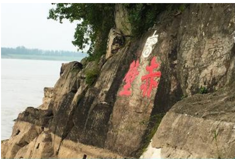
สมรภูมิผาแดง

พักที่ CHIBI HOTEL โรงแรมระดับ ดาวท้องถิ่นในเมืองชือปี้