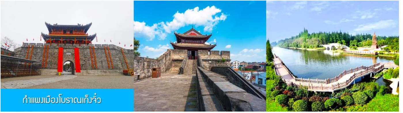
กำแพงเมืองโบราณเกิ่งจิว