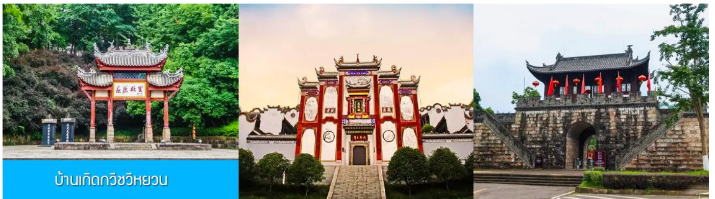
บ้านเกิดกวีหวิหยวน

พักที่ HONG QIAO HOTEL โรงแรมระดับ 4 ดาวหรือเทียบเท่าในเมืองหยีซัง