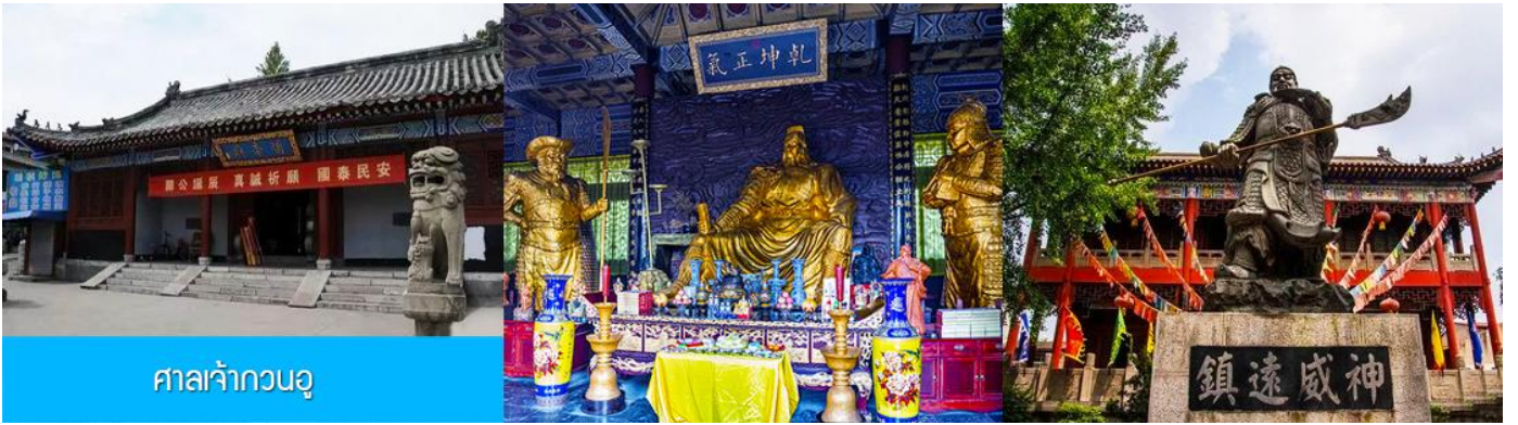
ศาลเจ้ากวนอู