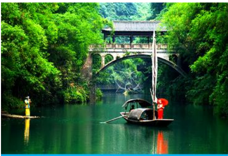
หมู่บ้านชาวนเลีย