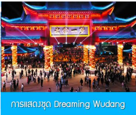
การแสดงชุด Dreaming Wudang