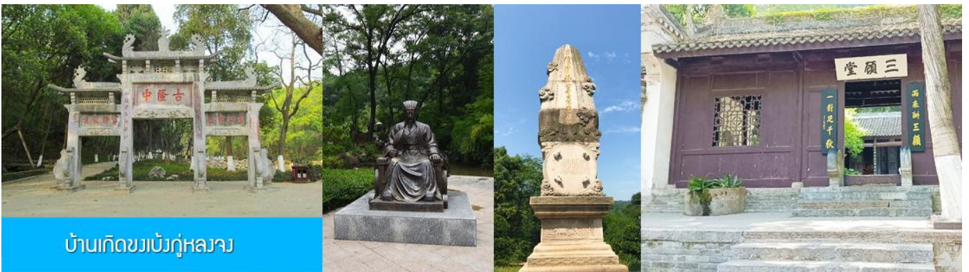
บ้านเกิดขงเบ้งกู่หลงจาง

พักที่ XIANGYANG MEIHAO HOTEL ระดับ 4 ดาวท้องถิ่นหรือเทียบเท่าในเมืองเซียงหยาง