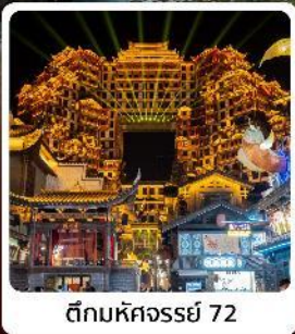
ตึกมหัศจรรย์ 72