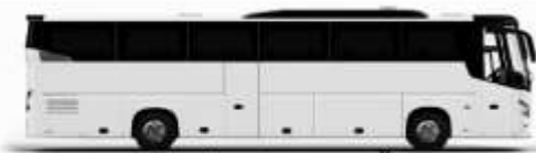
ตัวอย่างรูปภาพรถ 1 ชั้น