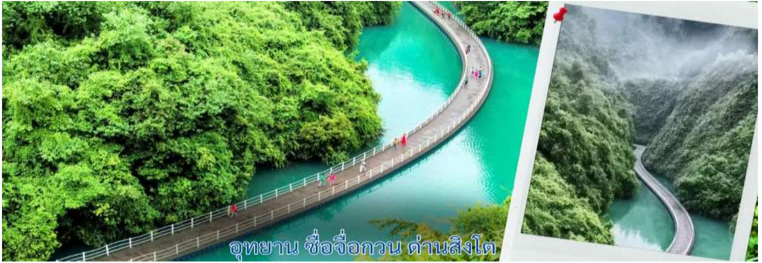
อุทยาน ชื่อจื่อกวน ด้านสิงโต

สะพานนี้ถือเป็นหนึ่งใน สะพานลอยน้ำที่ยาวและสวยที่สุดในจีน รถอุทยานสามารถวิ่งข้ามสะพานได้ ตอนเล่นผ่านคือทั้ง ตื่นเต้นและประทับใจมาก เพราะวิวรอบตัวคือภูเขาเขียวขจีและผืนน้ำที่สะท้อนท้องฟ้าอย่างสวยงาม