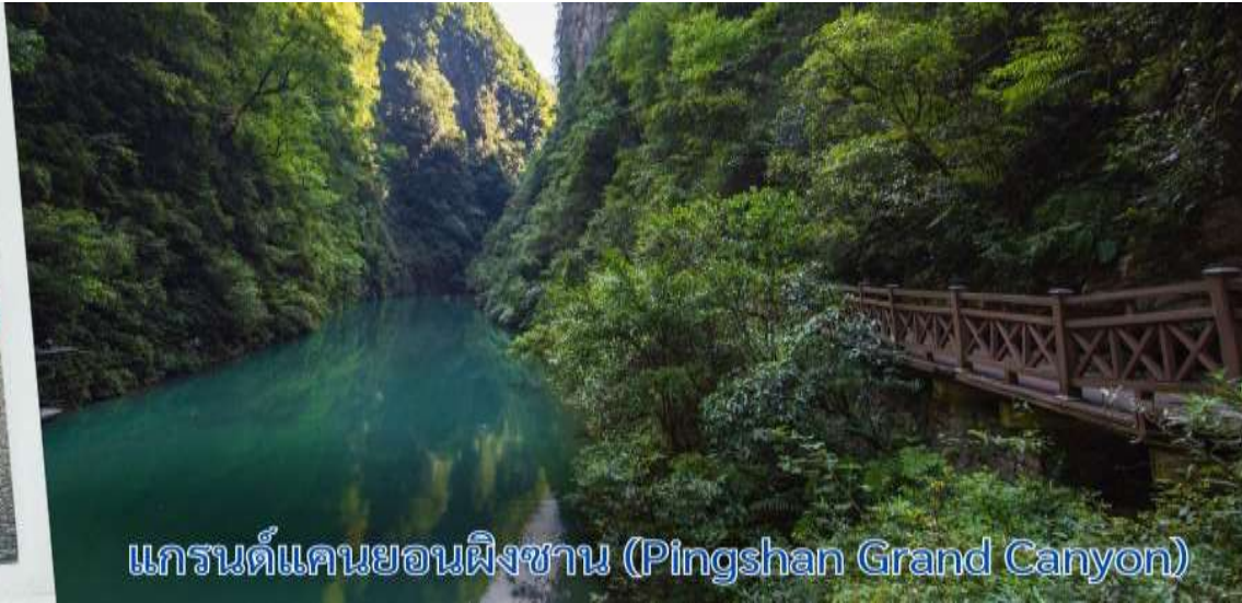
แกรนด์แคนยอนผิงซาน (Pingshan Grand Canyon)