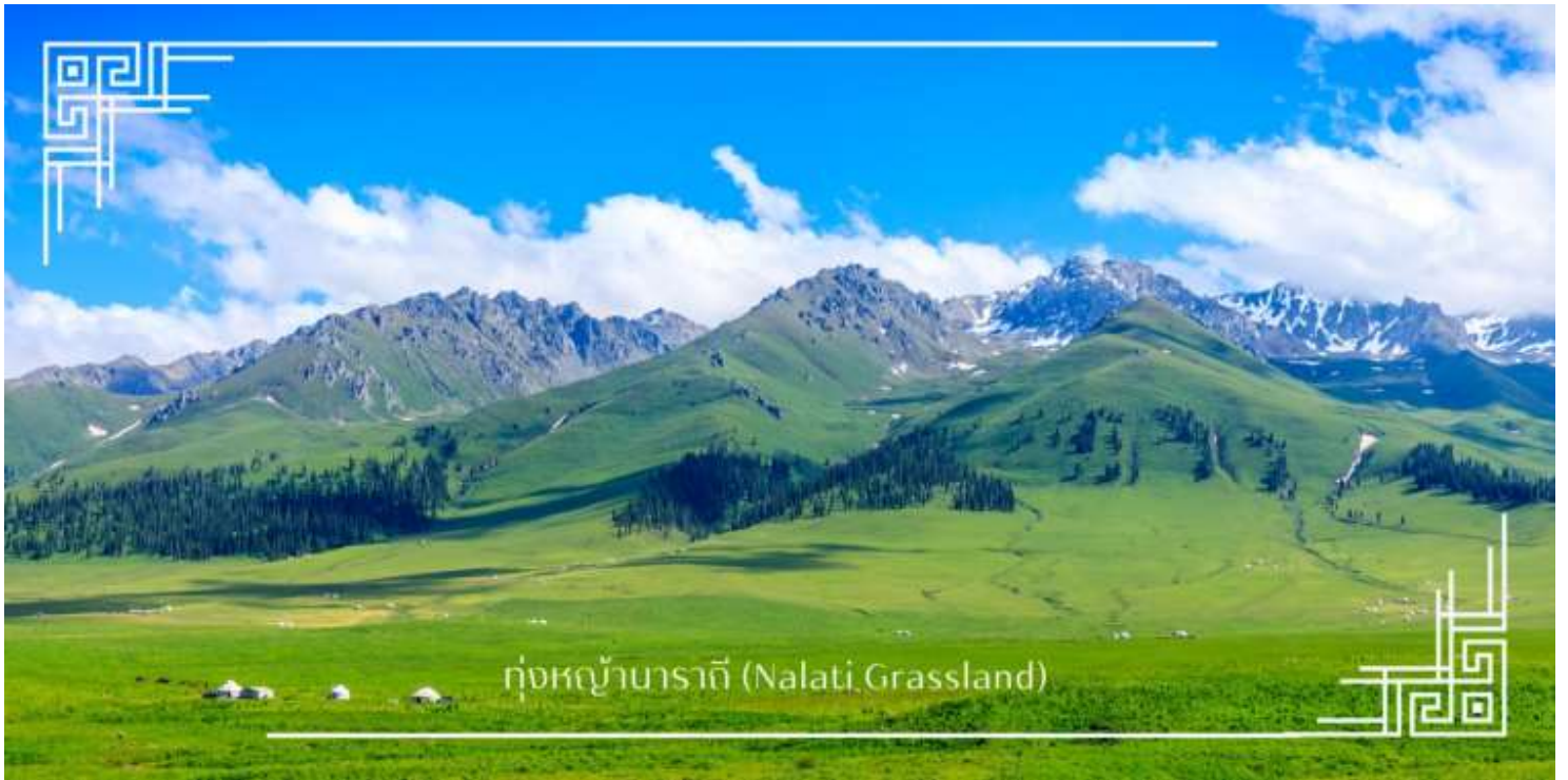
ทุ่งหญ้านาลาทิ (Nalati Grassland)