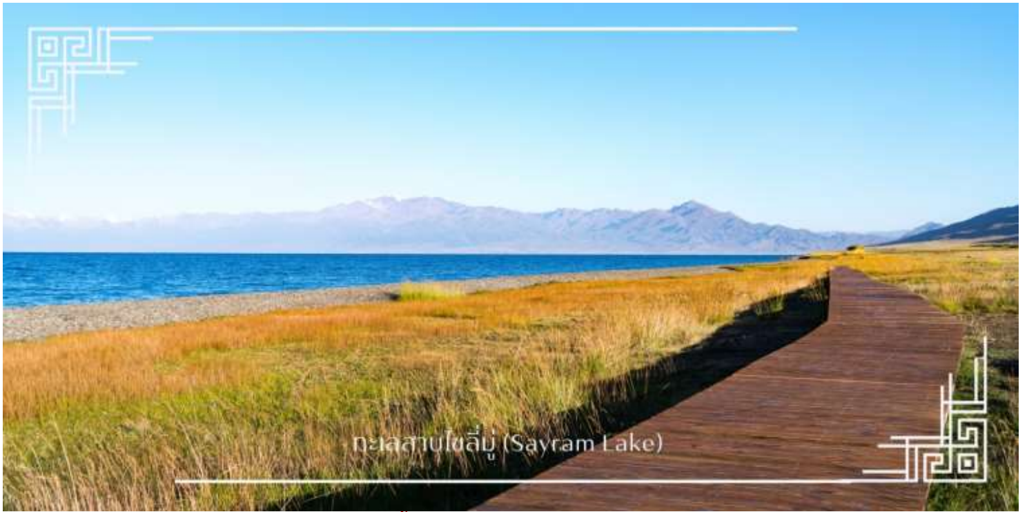
ทะเลสาบไซรัม (Sayram Lake)