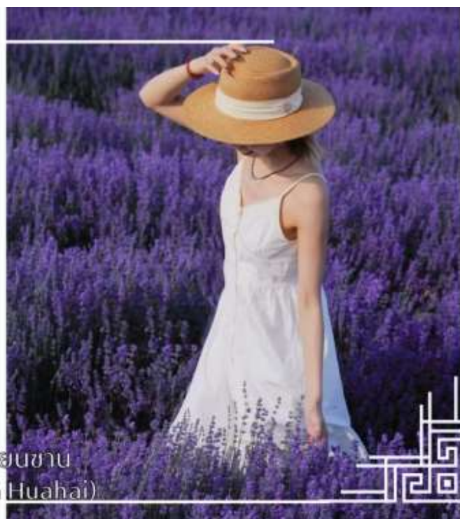
ทุ่งดอกไม้เทียนซาน (Yili Tianshan Huahai)

จากนั้นนำท่านสู่เมืองนาราลี (ใช้เวลาเดินทางประมาณ 3 ชั่วโมง)