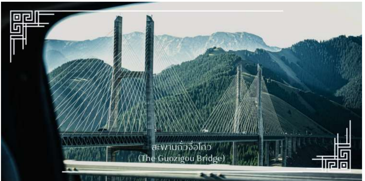
สะพานกัวจื่อโกว (The Guozigou Bridge)

จากนั้นนำท่านเดินทางสู่ ทุ่งดอกไม้เทียนซาน (ใช้เวลาเดินทางประมาณ 3 ชั่วโมง) โดยระหว่างทาง รถจะนำท่านผ่านชมความยิ่งใหญ่ของ สะพานกัวจื่อโกว(Guozigou Bridge) สะพานแขวนขนาดใหญ่ที่ทอดตัวข้ามหุบเขากัวจื่อโกวได้อย่างสง่างาม นับเป็นหนึ่งในผลงานวิศวกรรมที่โดดเด่นของจีนเจียง ด้วยโครงสร้างอันทันสมัยที่ผสมผสานเข้ากับภูมิประเทศภูเขาสูง ทำให้ที่นี่เกิดเป็นภาพทิวทัศน์ที่น่าสนใจและสวยงามอย่างมาก