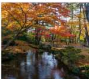
สวนเคนโระคุเซ็น