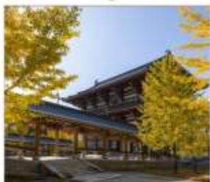
วัดไดชิซังเซอิโดจิ