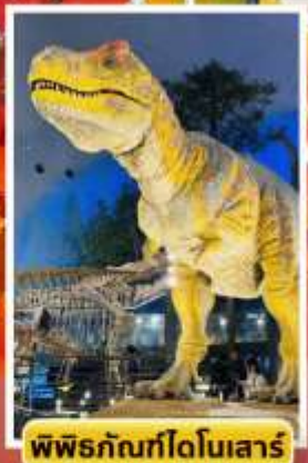
พิพิธภัณฑ์ไดโนเสาร์