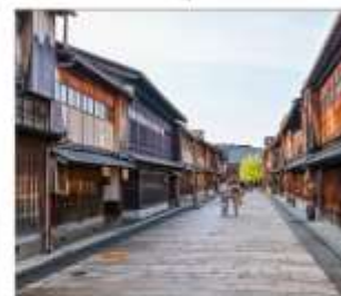
ย่านโรงน้ำชาอิงาชิบายะ