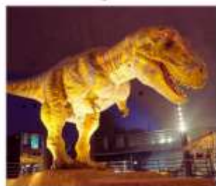
พิพิธภัณฑ์ไดโนเสาร์