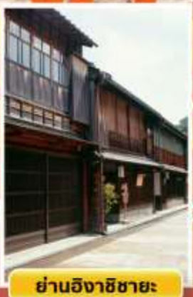
ย่านอิงาชิซายะ