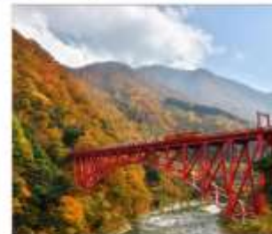
รถไฟชมวิวยุเมเวาคูโรมะะ