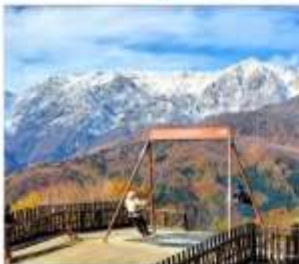
ฮาคูนะอิวาทาเกะ