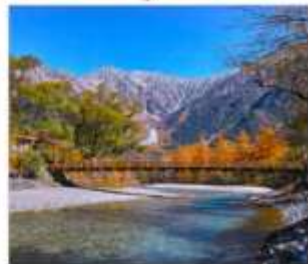
ดามิโดจิ