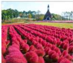
สวนดอกไม้มัมกคะโนะซาโตะ