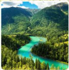
ทะเลสาบคานาสีอ