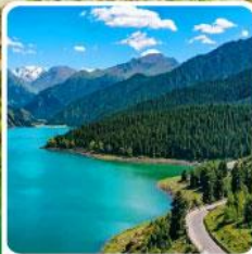
อุทยานเทียนชาน เทียนฉือ