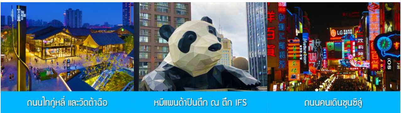
ถนนไท่กู๋หลี่ และวัดต้าเจี๊อ