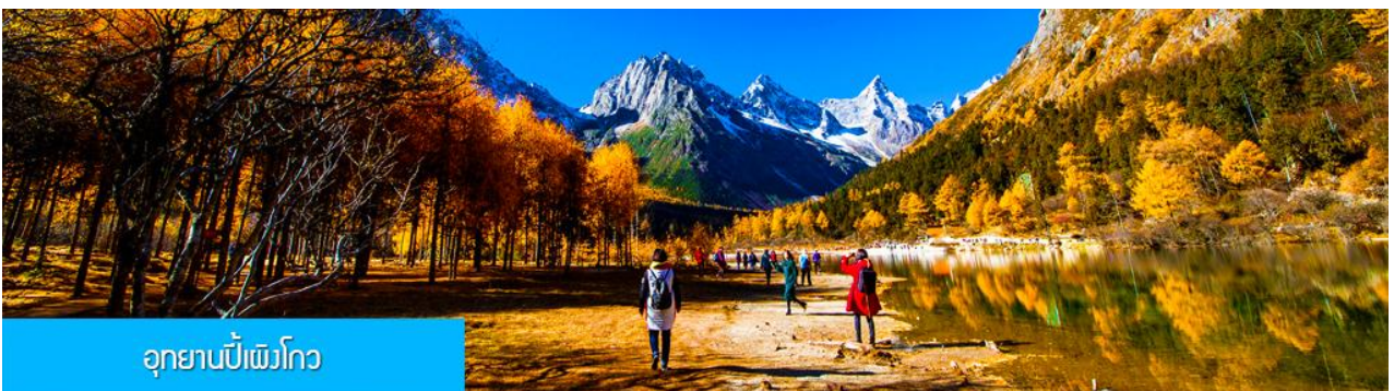
อุทยานเป่ย์เฟิงโกว