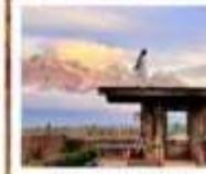
YUN DI AN CAFE