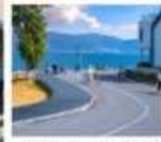
โถง 5 ทะเลสาบเอ๋อไห่