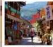
หมู่บ้านป๊ายา