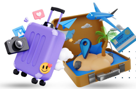
SPHZ-TA009 QINGDAO CLASSIC 6 วัน 5 คืน เดินทางด้วยสายการบิน Shandong Airlines (SC)

📍 702/36 Liang Muang (Asia Line), Khuan Lang , Hat Yai , Songkhla 90110 📞 074-805-494, 062-624-5492 📱 Good Holiday 📷 goodholiday_th 📧 @goodholidayth