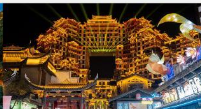
ตีทมห้ศจสรย์ 72