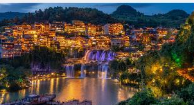
หมู่บ้านโบราณฝูหรงเจิน