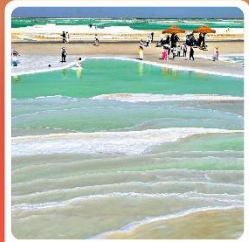
ทะเลสาบเกลือจาเอ้อหนาน

ไฮไลท์! กำมั่วเกาตุ กำพุทศศิลป์โบราณ มรดกโลก UNESCO ภูเขาสายรุ้งจางเย่ ภูเขาหินสีสันแปลกตา หนึ่งในภูมิประเทศที่แปลกที่สุดในโลก