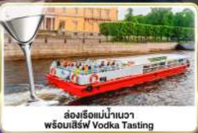
ล่องเรือแม่น้ำแคว พร้อมเสิร์ฟ Vodka Tasting