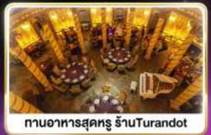
กานอาหารสุดหรู ร้านTurandot