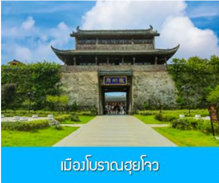
เมืองโบราณฮุยโจว