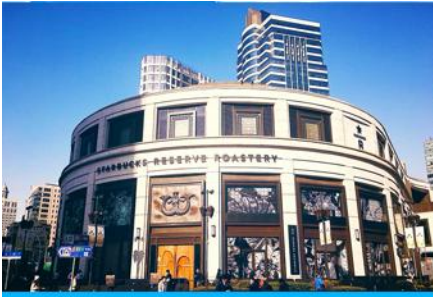
Starbucks Reserve Roastery