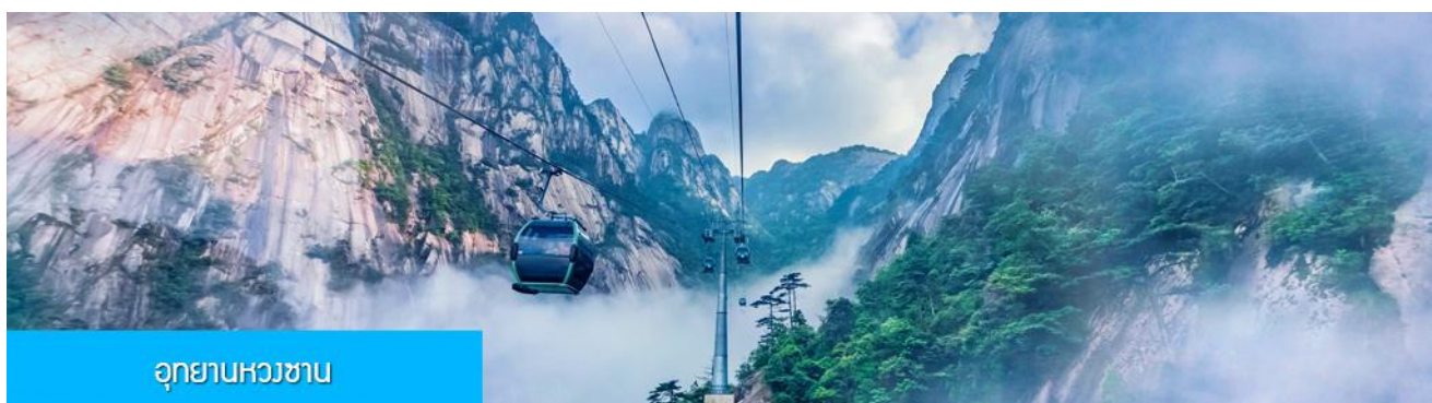
อุทยานหวงชาน