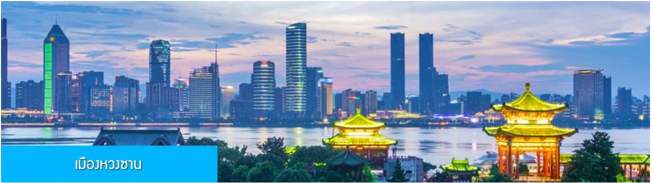
เมืองหางซ่าน