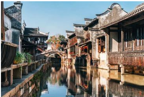
เมืองโบราณวูเจิน