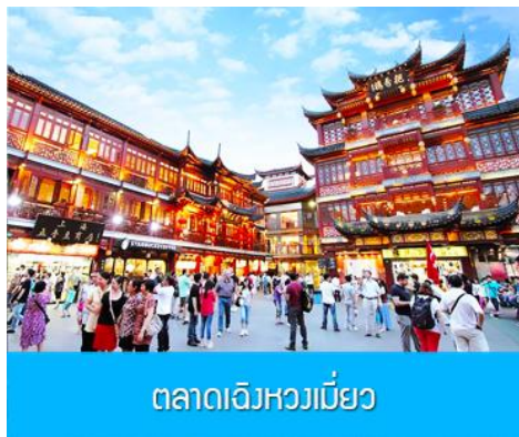
ตลาดเจิงหวงเมี่ยว

เช้า รับประทานอาหารเช้า ณ ห้องอาหารของโรงแรม (6)