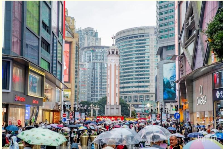
ถนนคนเดินเจี๋ยฟางเป่ย์

และนำท่านไป ถนนคนเดินเจี๋ยฟางเป่ย์ (Jiefangbei Street) ตั้งอยู่บริเวณอนุสาวรีย์ปลดแอก ซึ่งสร้างขึ้นเพื่อรำลึกถึงชัยชนะในการทำสงครามกับญี่ปุ่น แต่ปัจจุบันกลายเป็นศูนย์กลางทางการค้าขนาดใหญ่ ใจกลางเมือง เต็มไปด้วยร้านค้ามากกว่า 3,000 ร้าน ซึ่งมีทั้งอาหาร ซ้อปิ้ง มอลล์ขนาดใหญ่ ให้ท่านได้เดินชมและซ้อปิ้งกันอย่างจุใจ.