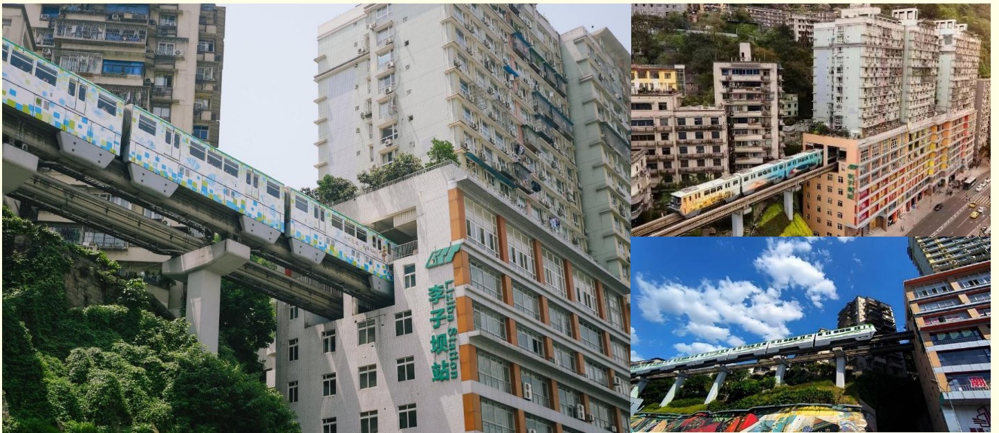
รถไฟฟ้าทะลุตึก

ขนำท่านชม รถไฟฟ้าทะลุตึก (Liziba Station) ตั้งอยู่ในเมืองฉงชิ่ง เป็นรถไฟชนิดพิเศษที่ถูกสร้างขึ้นบนตึกสูงถึง 19 ชั้น โดยนักวางแผนได้ทำการสร้างสถานี Liziba Station ในอาคารที่มีประชาชนพักอาศัยอยู่อย่างหนาแน่น ตั้งแต่ตึกชั้นที่ 6 ไปจนถึงชั้นที่ 8 โดยให้ประชาชนที่อยู่ในพื้นที่บริเวณนั้นสามารถใช้บริการรถไฟจากสถานีดังกล่าวได้อย่างสะดวกสบาย แม้ว่าประชาชนในพื้นที่บริเวณดังกล่าว จะอาศัยอยู่ในบริเวณที่ใกล้เคียงกับสถานีรถไฟที่เต็มไปด้วยความวุ่นวาย แต่เมื่อไหร่ก็ตามที่รถไฟได้เข้าสู่ชานชาลา ทางเจ้าหน้าที่จะปิดเสียงลงด้วยอุปกรณ์ชนิดพิเศษ ซึ่งจะทำให้เสียงของรถไฟไม่ดัง