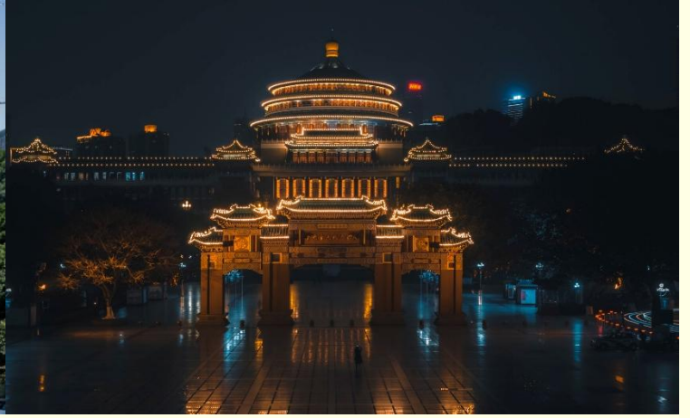
ศาลาประชาชน