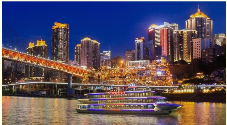
Option เสริม ล่องเรือราตรีชมแม่น้ำสองสาย

*ราคาทัวร์นี้ยังไม่รวมค่าบริการค่าล่องเรือ สำหรับท่านที่สนใจจะมีค่าบริการท่านละ 300 หยวน (ราคาอาจมีการเปลี่ยนแปลง กรุณาตรวจสอบราคาก่อนซื้ออีกครั้ง)*