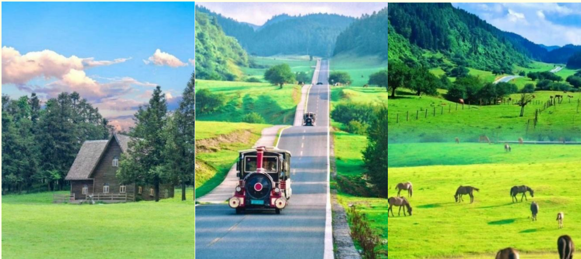
อุทยานเขานางฟ้า

นำทุกท่านเดินทางสู่ อุทยานเขานางฟ้า (FAIRY MAIDEN MOUNTAIN) ตั้งอยู่ทางตอนเหนือของแม่น้ำอูเจียง ระดับความสูง 1,900 เมตรจากระดับน้ำทะเล มียอดเขาสูงที่ 2,033 เมตร อุทยานท่องเที่ยวทางธรรมชาติของเมืองอู่หลงที่ถือว่าอยู่ในระดับ 5A ของประเทศจีน ที่อุทยานแห่งนี้ได้รับการกล่าวขานว่าเป็นอุทยานที่มีชื่อเสียงในเรื่องของความสวยงามทางธรรมชาติสามารถท่องเที่ยวได้ทั้งปี เนื่องจากในแต่ละฤดูก็จะมี ความสวยงามแตกต่างกันออกไป ได้รับการขนานนามว่า “ดินแดนแห่ง 4 สิ่งมหัศจรรย์” ได้แก่ มีป่าไม้หนาแน่น มียอดเขาประหลาด มีทุ่งหญ้าเลี้ยงสัตว์ และมีลานหิมะในฤดูหนาว (รวมรถราง)