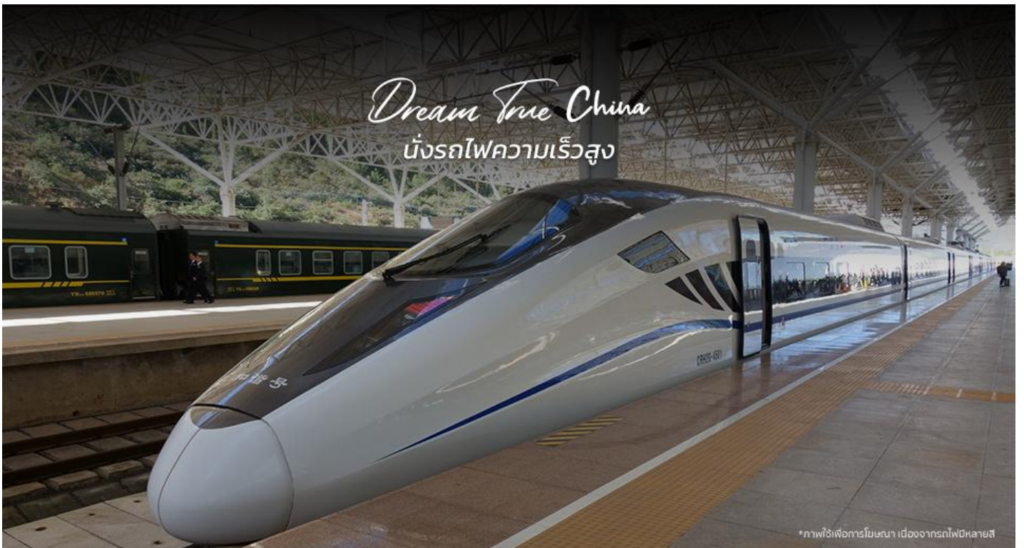
*ภาพใช้เพื่อการโฆษณา เนื่องจากรถไฟหลายสี

**ขบวนรถไฟอาจมีการเปลี่ยนแปลง** หมายเหตุ: เพื่อความสะดวกในการเดินทางของท่าน ทางบริษัทฯจะนำกระเป๋าเดินทางของท่านขึ้นรถบัส โดยท่านถือเฉพาะสิ่งของสำคัญ และจำเป็นขึ้นรถไฟความเร็วสูงเท่านั้น รถบัสจะนำกระเป๋าเดินทางของท่านไปจัดเตรียมไว้ที่โรงแรม