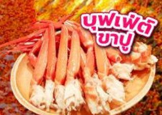
บุฟเฟ่ต์ ขาปู

ชมใบไม้เปลี่ยนสี อุโมงค์ใบเมเปิ้ล โมมิจิ ไคโร