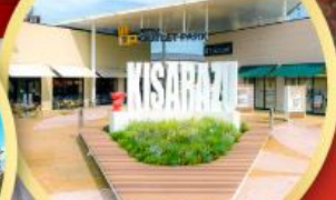
มิตซึย เอ้าท์เล็ต พาร์ค คิชะระชู