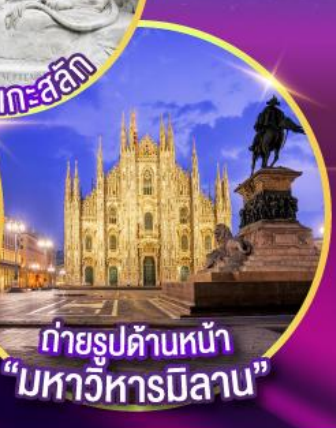
ถ่ายรูปด้านหน้า "มหาวิหารมิลาน"