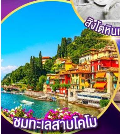
ชมทะเลสาบโคโม