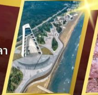
หอคอยกาลเวลา