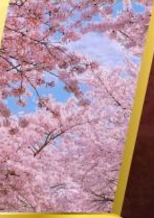
ซากุระจงซาน

JTAAO-SC2SP สเปนเซียล...ชิงเต่า เยียนไท เว่ยไห่ ซากระ หอคอยกาลเวลา 6 วัน 4 คืน ไม่เข้าร้านรัฐ บินตรง