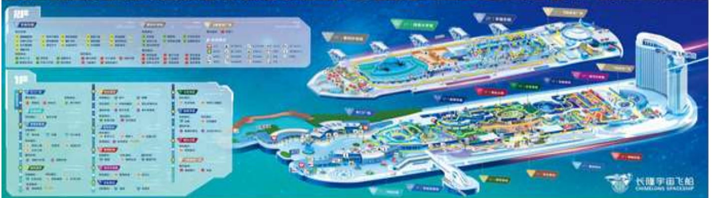
คำ | บริการอาหารทำด้วยบุฟเฟ่ต์ของโรงแรม อิสระตามอัธยาศัย พักในสวนสนุก 📍 โรงแรม ZHUHAI SPACESHIP HOTEL (1)