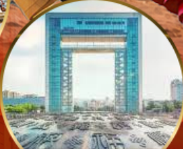
ประตูแห่งความสุข