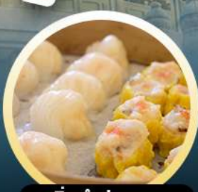
ติ่มซำฮ่องกง