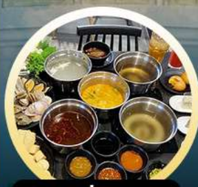
ชาบูฮ่องกง