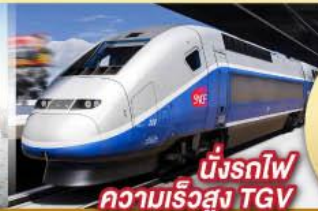
นั่งรถไฟความเร็วสูง TGV