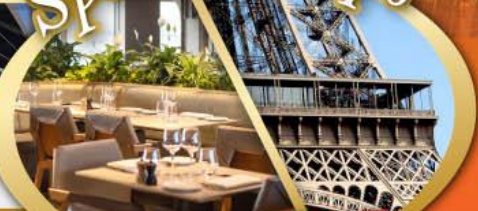
รับประทานอาหารกลางวันบนหอคอไอเฟล

ไฮไลท์ในโปรแกรม • สะพานไม้ชาเปล ลูเซิร์น