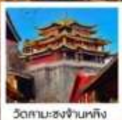
วัดสาม-ซงจ้านหลิง