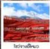
ไร่ชางอีหมว