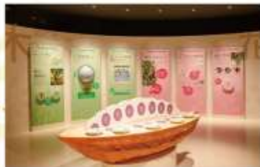
ROYCE CACAO & CHOCOLATE TOWN