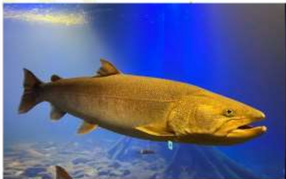
NORTHERN DAICHI AQUARIUM

เปิดโลกใต้ผืนน้ำทางเหนือที่ "พิพิธภัณฑ์สัตว์น้ำคิตะโนะไดจิ" อควาเรียมสุดล้ำที่ออกแบบมาเพื่อจำลองระบบนิเวศของแม่น้ำในฮอกไกโดได้อย่างสมจริงที่สุด ไฮไลท์สำคัญคือการชม "ปลาโอโตะ" ปลาน้ำจืดขนาดยักษ์ในตำนานที่หาชมยาก และดูกระเจกที่ออกแบบพิเศษให้เห็นปลากระโดดทวนน้ำท่ามกลางบรรยากาศป่าไม้ที่สวยงาม