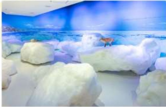
OKHOTSK RYUHYO MUSEUM