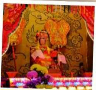
เจ้าแม่ทับทิม จอสเฮ้าส์เบย์