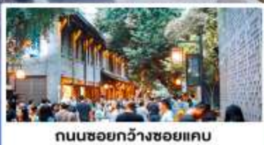
ถนนชอยกว้างชอยแคบ