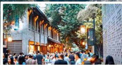
ถนนชอยกวางชอยแคบ