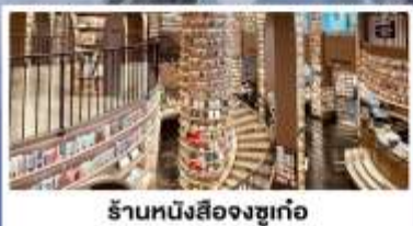
ร้านหนังสือจางเก๋อ