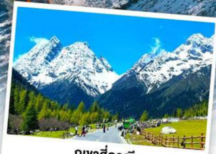
กุเวาสีครุณี

เดินทางโดย: สายการบินเจียงตูแอร์ไลน์ (EU)