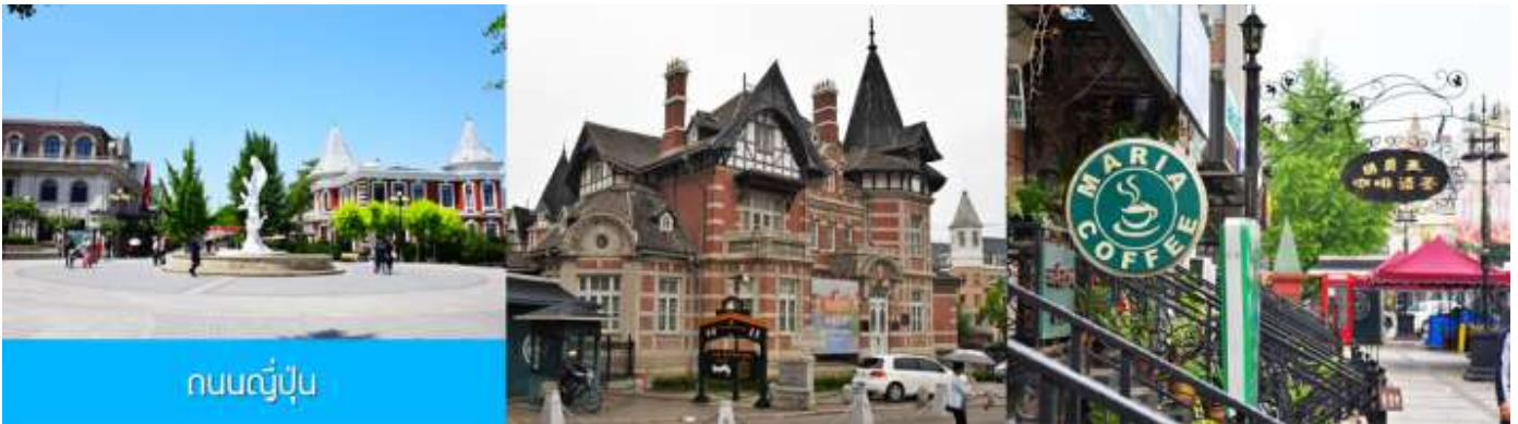
ถนนญี่ปุ่น