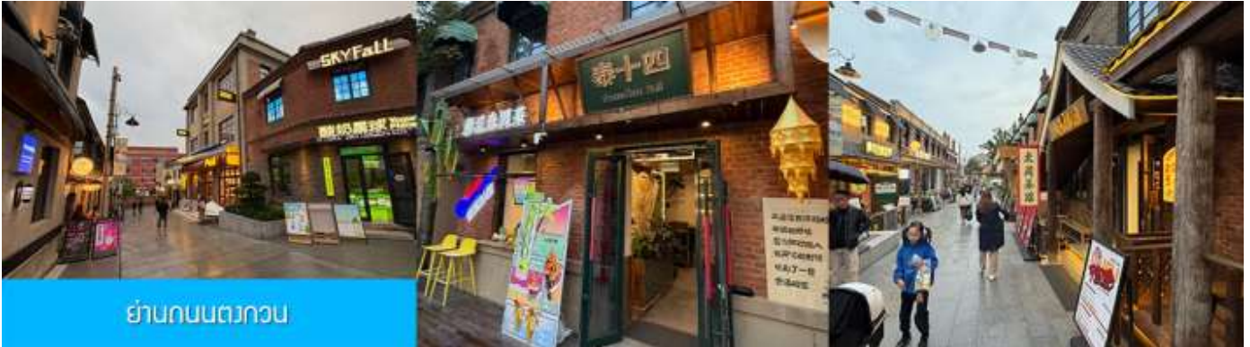
ย่านถนนตวงกวน

หลังอาหารนำท่านเที่ยวชม จัตุรัสชิงไห่ 星海广场 เป็นจัตุรัสขนาดใหญ่เป็นแลนด์มาร์คสำคัญของเมืองต้าเหลียน สร้างขึ้นเพื่อเฉลิมฉลองในโอกาสที่รัฐบาลอังกฤษคืนเกาะฮ่องกงให้จีนในปี ค.ศ. 1997 ตั้งอยู่ชายฝั่งทะเลในเมืองต้าเหลียน เป็นจัตุรัสใจกลางเมืองที่ใหญ่ที่สุดในโลกและเป็นแลนด์มาร์คของเมืองต้าเหลียน รายล้อมด้วยตึกระฟ้าที่ทันสมัย ภายในมีบ่อน้ำพุดนตรี ลานหญ้าขนาดใหญ่ และลานกว้างสำหรับจัดกิจกรรมกลางแจ้ง อาทิ เทศกาลเบียร์นานาชาติ การแข่งขันวิ่งมาราธอน งานแฟชั่นนานาชาติเมืองต้าเหลียน ฯลฯ