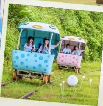
Shen'ao Rail Bike