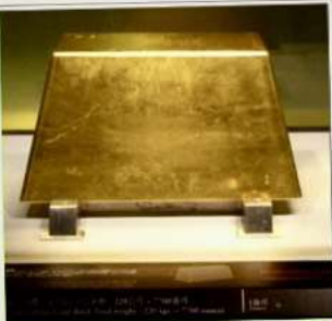
พิพิธภัณฑ์ทองคำ