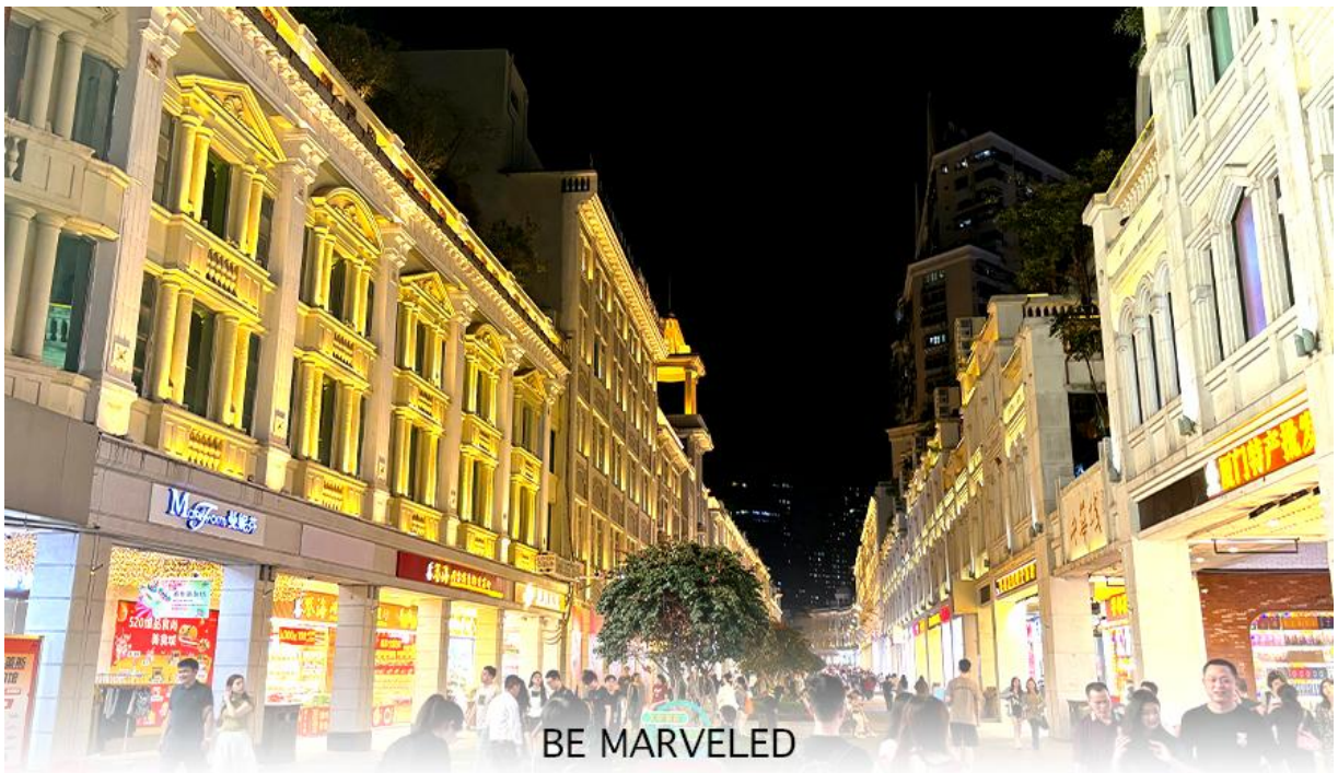
BE MARVELED ถนนคนเดินจงซานหลู่

จากนั้นนำท่านเดินทางไป ถนนคนเดินจงซานหลู่ เป็นถนนการค้าเก่าแก่ที่มีชื่อเสียง เป็นศูนย์กลางแฟชั่นและย่านช้อปปิ้งสำคัญของเมือง นอกจากนี้ ยังมี "สวนจงซาน" (Zhongshan Park) ซึ่งเป็นสวนสาธารณะขนาดใหญ่ใจกลางเมือง